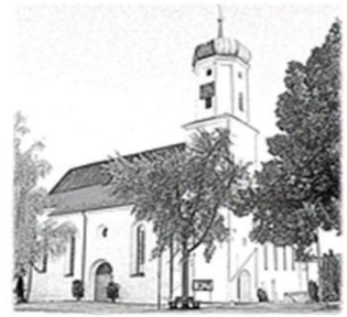
St. Sebastian Ottenbach