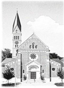
St. Margaretha Salach